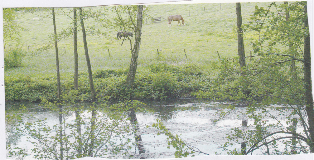
er zijn nieuwe paarden in het park ☺