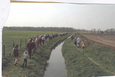
mensen een optocht van mensen