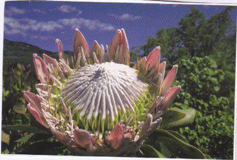
groot sax des grotte bloem