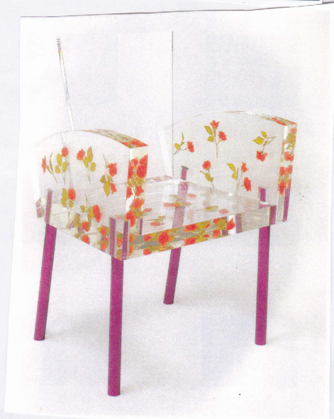
mooi sweels mooiste stoel